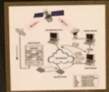
Figure 3: Technical details of initial protocols

symmetric-key digital certificates and a source authentication protocol for group communication in hybrid networks, extensions to space communications, including Internet service to planes, to the International Space Station (ISS) and expedition teams on the moon (Fig. 4).