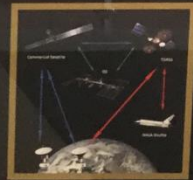
Figure 4: High data rate Internet to the ISS, planes

Baras' results were implemented, in a long-term (1993-2004) successful collaboration with Hughes Network Systems (HNS) engineers, in several HNS award-winning products (Turbo Internet, DirecPC, DirecDuo, DirecWay). These culminated with HughesNet, the company's largest single business. Baras' many contributions and innovations made possible widespread Internet connectivity via satellite and other wireless networks, at rates reaching 10s and 100s of Mbps. They were essential to the creation of the industry sector for Internet services over satellite, serving consumers, businesses, ships, aircraft, remote oil rigs, military networks, and facilitating Internet connectivity to rural and underdeveloped areas, telemedicine services, environmental information, and emergency and disaster relief. Today many companies provide such services and products, with billions in sales, tens of millions of users, and broad societal impact. Baras graduated 22 M.S. and 11 Ph.D. students who worked on the theme of Internet over satellite, all of whom joined the new industry.